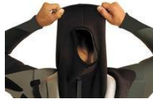
インナーネックを被る