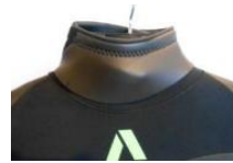
別売ブーメランベルトを使えば首部からの浸水も最小限。