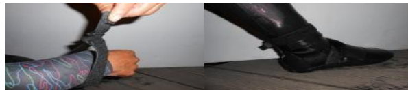
別売の手首、足首ベルトを使用して下さい。