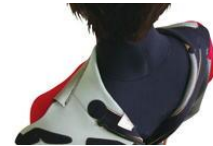
スーツ内への浸水を抑える